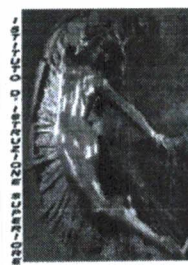
"G. RENDA" - POLISTENA

Sito WEB : http://www.istitutorenda.gov.it