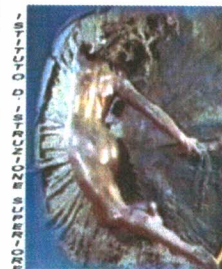
"G. RENDA" - POLISTENA

Sito WEB : http://www.istitutorenda.edu.it