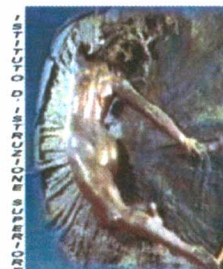
"G. RENDA" - POLISTENA

Sito WEB : http://www.istitutorenda.edu.it