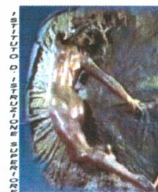
"G. RENDA" - POLISTENA

Sito WEB : http://www.istitutorenda.edu.it